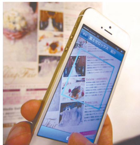
スマホに最新情報を簡単に表示することができる

その点、SkyDesk Media Switchの反応やコンテンツの人氣を把握・分析することで、今後の施策に生かすことができる。