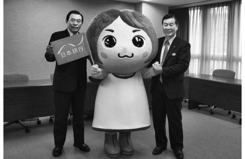
日本旅行の女子旅キャラクター「たびーらちゃん」と

丸尾 中計で最大限の協力を、日本旅行さんの力で、日本旅行さんのお客さまの拡大に結び付けて、日本旅行さんの方々に参加してもらい、われわれが台湾での観光・物産を密に、絆をより深めていきたい。また、東北支部連合会への復興支援、日本旅行の会員拡大や、日本旅行さんへの顧客紹介運動の強化など