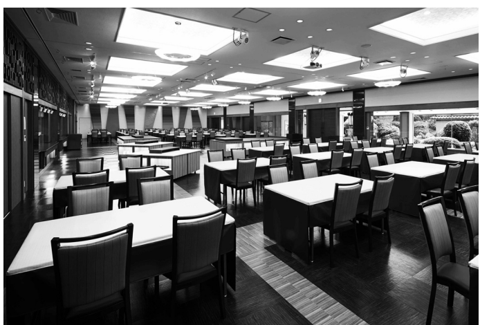
富山県/魚津 金太郎温泉 多彩な食の演出の場として、コンベンションホール「ガイア」オープン