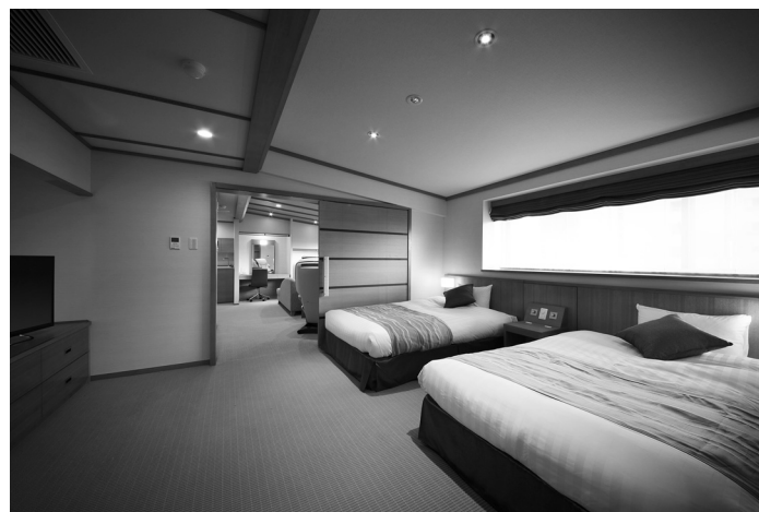
山形県/蔵王温泉 蔵王国際ホテル 狭小客室をトップクラスの客室へ、プレミアムモダン空間「Junior Suite」客室