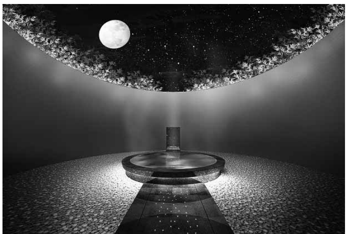
三重県/賢島温泉 汀渚 ばさら邸 新貸切風呂「月の宮」誕生 計画的に施設商品のブラッシュアップを続ける高稼働の人気宿