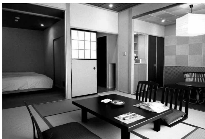
群馬県/伊香保温泉 ホテル天坊 客室の標準化を目指し、中期計画に基づくC棟改装工事第二期が完了