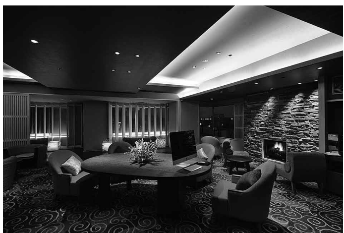
滋賀県/琵琶湖畔おごと温泉 湯元館 はなれ葎蘆葦 客室棟「月心亭」5フロアを全面改装して誕生した新たなブランド「はなれ葎蘆葦」KAROL