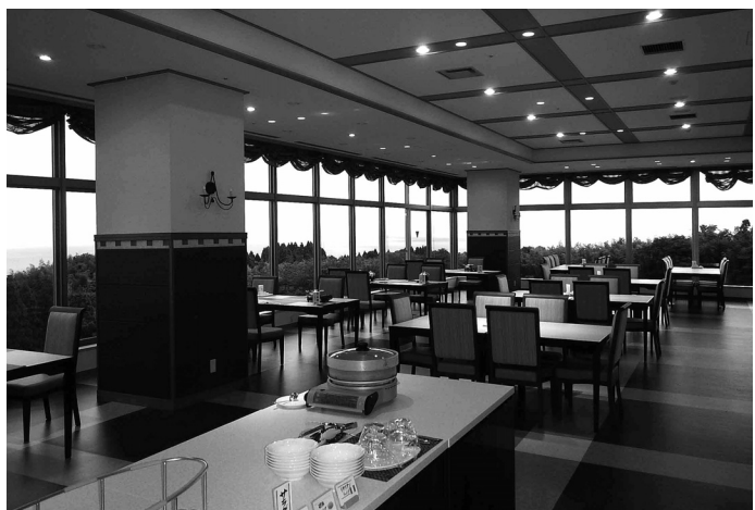
富山県/雨晴温泉 磯はなび 個人客化へ対応する新ダイニングスタイル「ラブラージュ」改装オープン