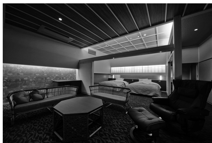
京都府/湯の花温泉 京 YUNOHANA RESORT 翠泉 老舗高級旅館をリニューアル、伝統を継承した「和」のオーベルジュとして開業