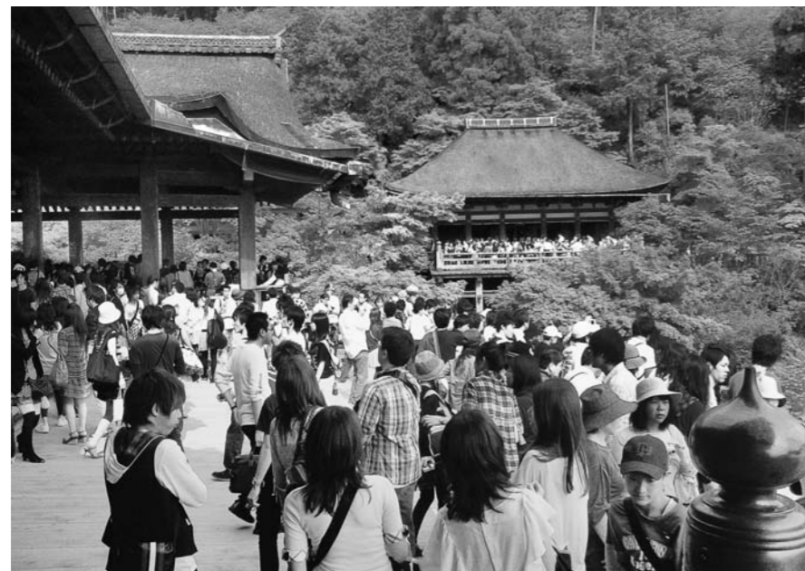
多くの観光客でにぎわう清水寺