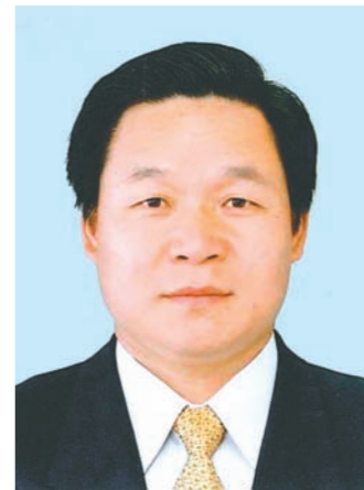
中国国家観光局(東京) 首席代表 張 西龍氏

今年の日中国交正常化40周年を記念する「日中国民交流友好年」。中日間の交流を中国全土に拡大して、流入人口は、特に2003年来、着実に拡大を続けていて、中国が訪日日本人を査証免る。