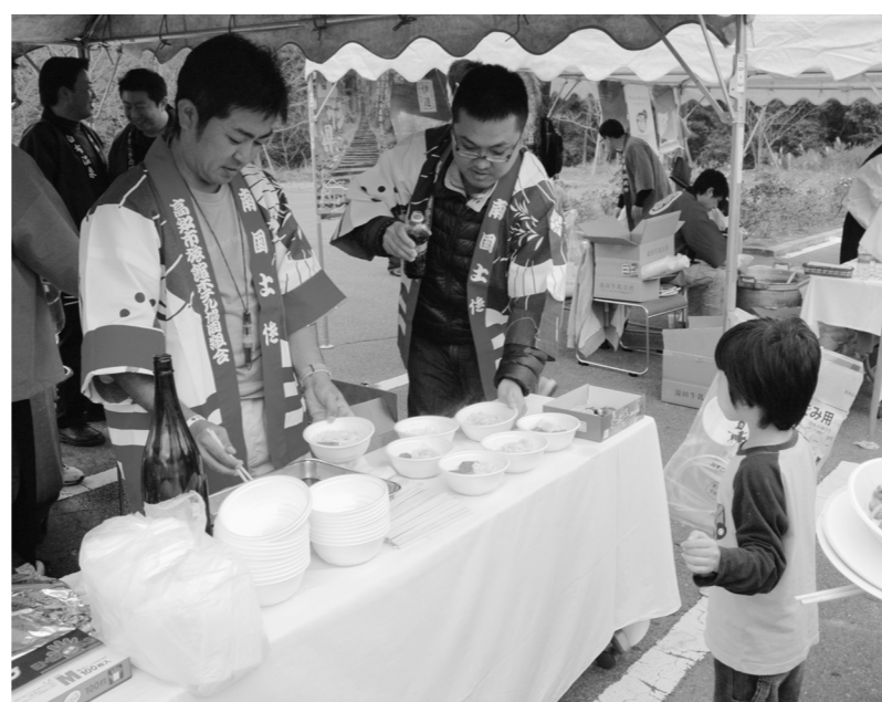
全旅連青年部が福島県南相馬市で被災地復興支援事業。子どもたちに全国のご当地グルメを振る舞った(11月26日付)