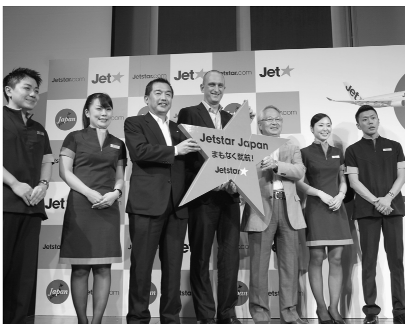
JALがカンタスグループなどと共同で格安航空会社(LCC)を設立すると発表。国内資本のLCCが増える(8月20日付)