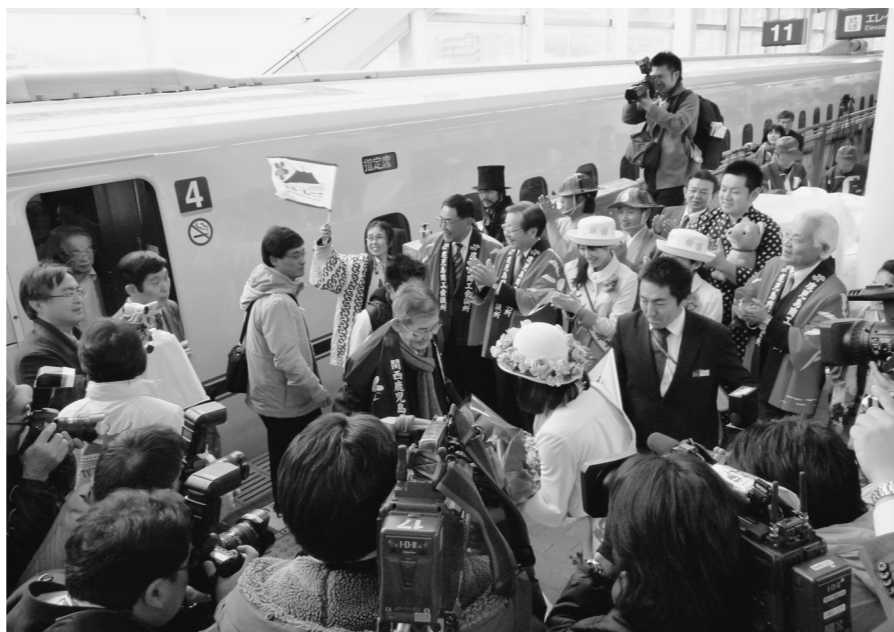
九州新幹線が全線開業。山陽新幹線との直通運転も始まった。鹿児島中央駅では新大阪駅からの一番列車を出迎え。記念式典は前日に発生した東日本大震災の影響で中止になった(3月19日付)