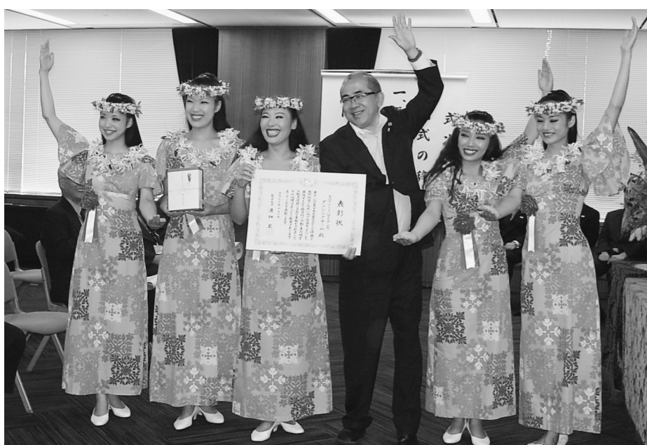
スパリゾートハワイアンズのダンシングチーム「フラガール」が観光振興への貢献で今年度の観光庁長官表彰を受ける(10月8日付)