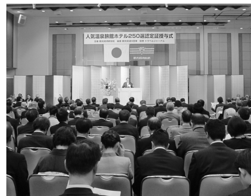
本社主催の2010年度人気温泉旅館ホテル250選認定証授与式。受賞旅館・ホテル、来賓など約500人が集まった(1月29日付)