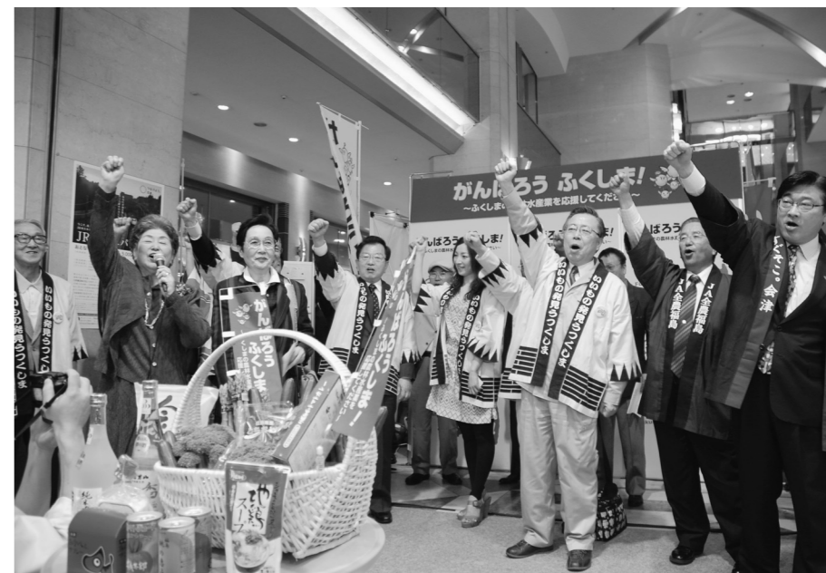
風評被害払拭へ福島県が「がんばろうふくしま運動」を開始。佐藤知事、県内市町村長、農業関係者らが首都圏に集まり、コールで氣勢を上げる(5月21日付)