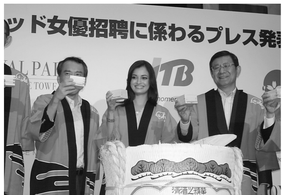
観光庁が新たな訪日旅行市場として注目されるインドから人気女優のディア・ミルザさんを招待。日本の観光魅力発信を期待した(9月3日付)