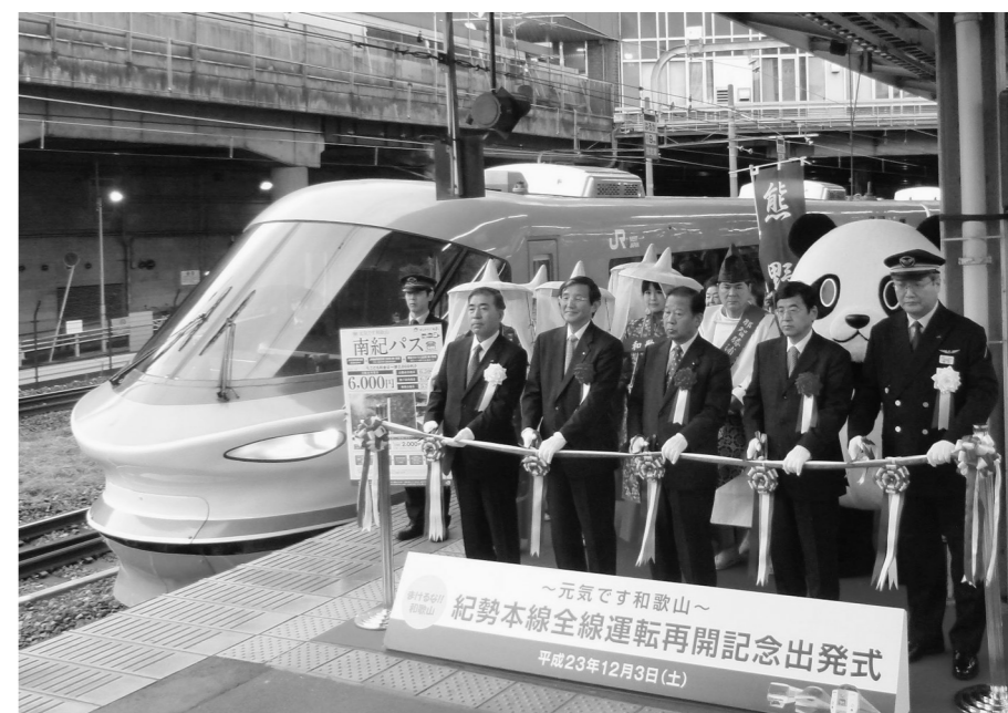
台風12号で一部不通となったJR紀勢本線が全面復旧。新大阪駅で出発式が開かれる。和歌山県の仁坂知事、二階元経産相らがテープカット(12月10日付)