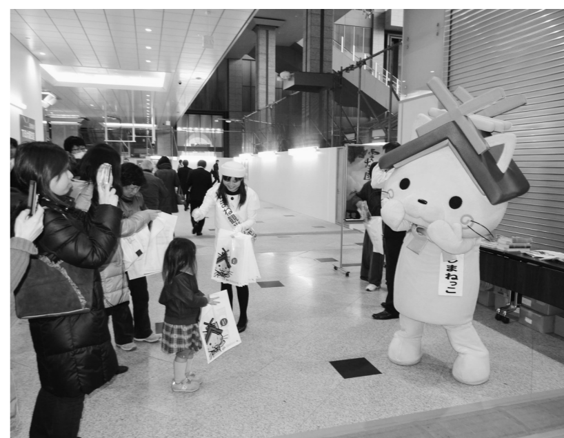
大雪の風評被害払拭へ、島根県が大坂で街頭イベント。観光キャラクター「しまねっこ」もPRにひと役(2月19日付)