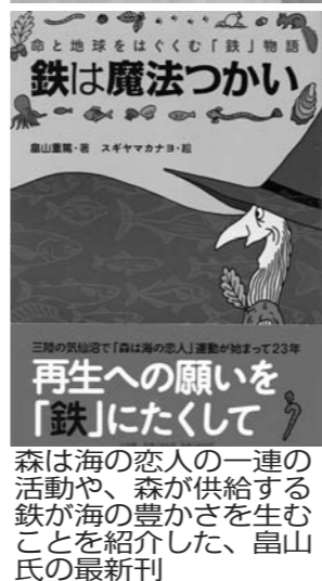
森は海の恋人の紹介した、最新刊「鉄は魔法つかい」の再生への願いを「鉄」にたくして

トップツアーが長期的に後押し カキをはじめとする豊かな海の幸を育む森づくりや、森川海の連環を子ども達に伝える環境教育を行い、日本のみならず世界中から注目を浴びているNPO「森は海の恋人」。トップツアーでは被災地の現状や、周辺の森づくりなどについて知ってもらうべく、9月25日、岡山県備前市・森は海の恋人理事長を講師に招き、岩手・花巻温泉を開いたトップツアーメモリアル研修会でカキの森づくりの意義や震災復興とのかかわりについて講演会を行った。写真。