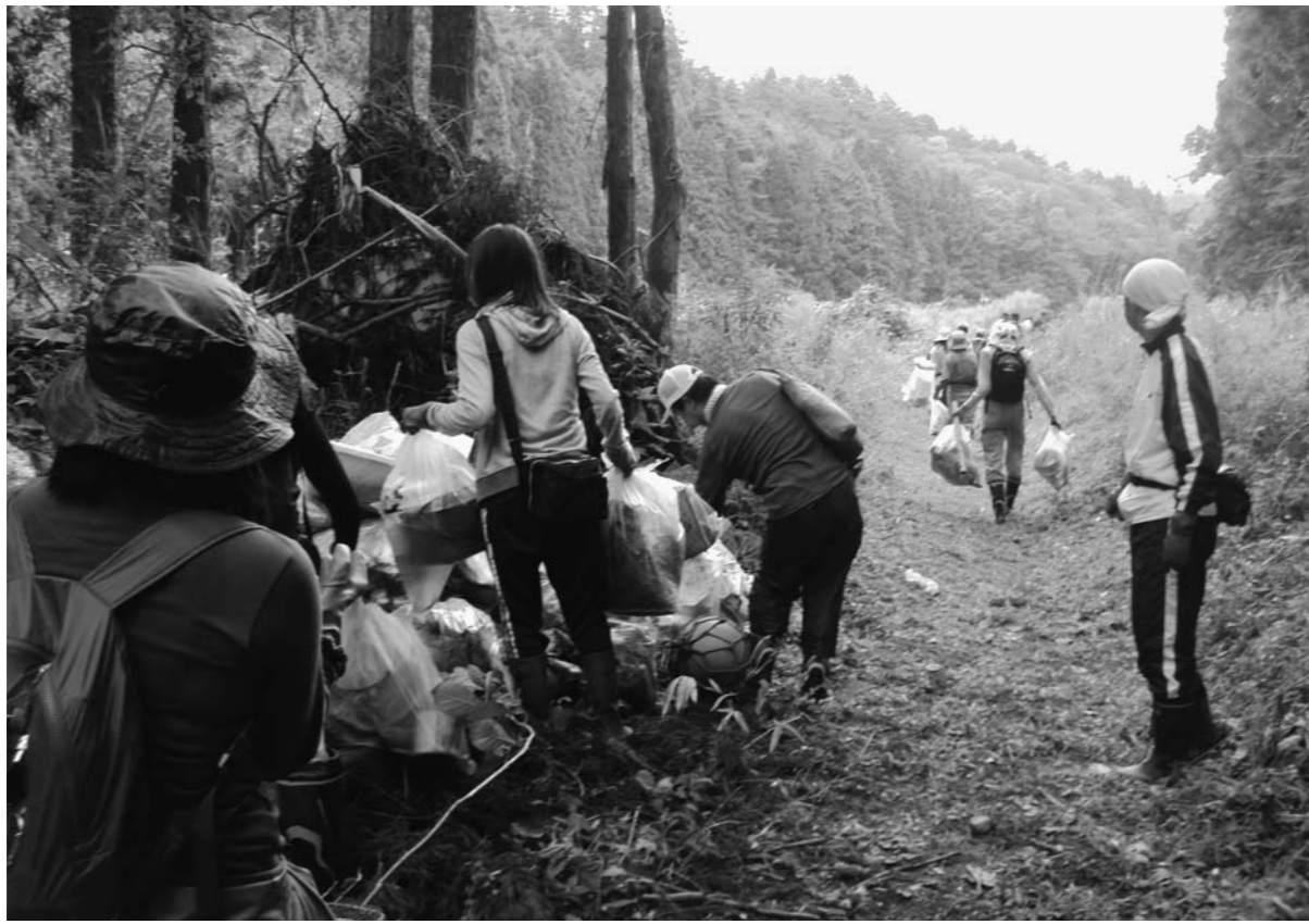
上流の森の清掃活動