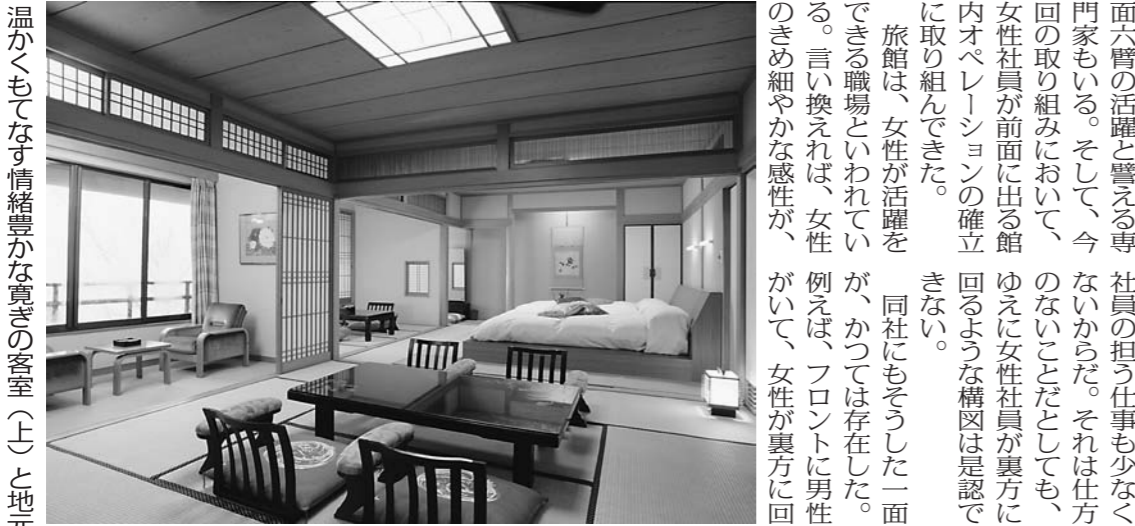
温かくもてなす情緒豊かな寛ぎの客室(上)と地元の素材にこだわった料理

旅館は、立地する環境に合った施設展開によって、非日常性を満たすことが求められる。旅館は、顧客にとって特別な場所である。だからこそ、従業員は最高のパフォーマンスを発揮し、顧客に最高のサービスを提供しなければならない。従業員のモチベーションを高めるためには、経営者が彼らの働きを認め、感謝の言葉を伝えることが重要である。また、従業員が自分たちの仕事に誇りを持てるように、経営者は彼らのスキルを伸ばし、彼らに成長の機会を提供する必要がある。