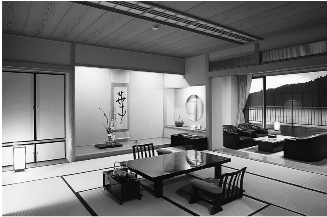
佇まい、調度、眺望、すべての客室に和の趣き豊かにこだわりと工夫を凝らす

「パートから社員主体へシフト」は、経営改善の重要なポイントである。パート社員に比べて、社員は責任感と誇りを持って働く傾向がある。パート社員を増やせば、短期的には人手不足を解消できるが、長期的には従業員のモチベーションを低下させる可能性がある。一方、社員主体の体制にシフトすることで、従業員のモチベーションを高め、顧客に対するサービス品質を向上させることができる。また、社員主体の体制は、経営の透明性を高め、顧客の信頼を得るのに役立つ。