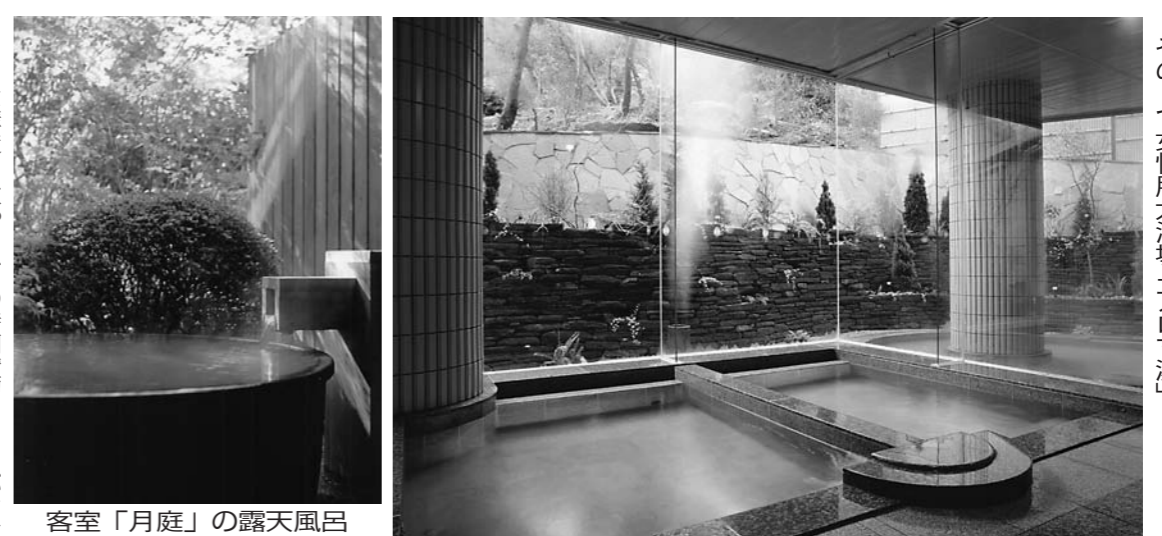
敷地内から湧き出す4つの源泉で温泉めぐり。その1つ女性用大浴場「アロマ湯」

旅館には、さまざまな形態がある。顔も呼ばれていない。無難にいなな特化だが、バブル経済が崩壊したあとの価格志向、さらにリマシニックの追い打ちで無難路線だけでは対応できなかった。雲仙温泉の新湯は、そうした中において多様な顧客層に使いやすい客室に、さまざまな客層に対応し、それぞれのニーズに応じたサービスを提供している。経営者は、顧客のニーズを把握し、彼らに最適なサービスを提供する必要がある。