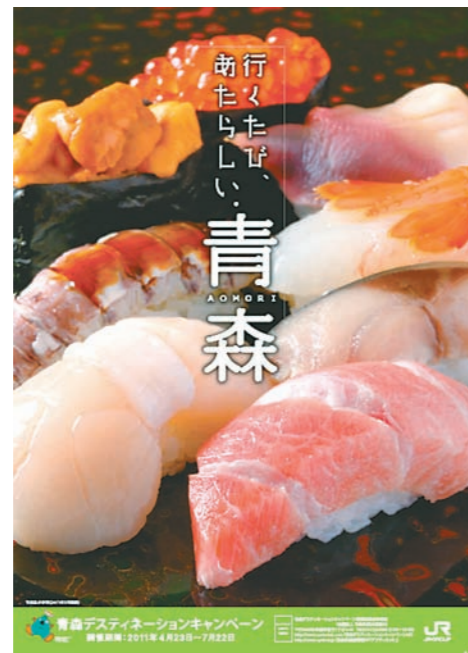
DCの5連ポスター（左から黄金崎不老ふ死温泉、青森県の寿司）