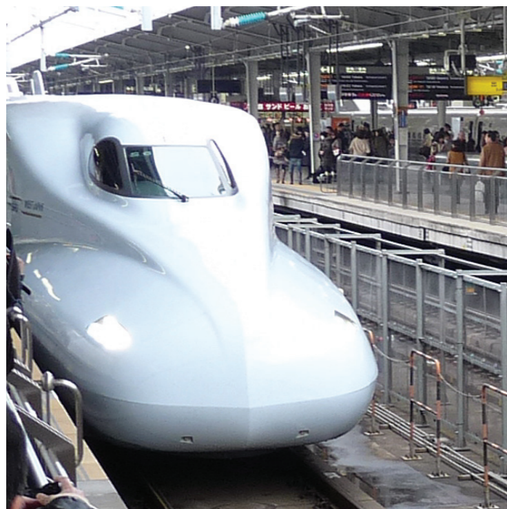
山陽・九州新幹線相互直通車両「みずほ」・「さくら」

3月12日に新大阪と鹿児島中央を結ぶ山陽・九州新幹線の相互直通運転が始まる。04年の九州新幹線の一部開通から7年。所要時間は、みずほの最速列車で新大阪〜熊本間は3時間を切り、新大阪〜鹿児島中央間は4時間を切る3時間45分。関西と九州はもとより沿線には多くの観光客が訪れ、活発な交流が始まることとなる。 快速な直通新幹線登場。多彩な計画が組み、九州新幹線全線開業。や、これまで関西に合わせた、新大阪から訪れるのが難しかった温泉や観光地にも足を伸ばせる。滞在時間も長くなる。 東海道・山陽新幹線を走る最新車両のN700系をベースに開発された、現行の山陽新幹線「ひかりレールスター」の快適性に九州新幹線「つばめ」の木目調のデザインを採用した。鹿児島中央までは、鹿児島中央までの約4時間の移動を快適にするため、普通車指定席は「みずほ」と「さくら」と同じ列車「みずほ」と「さくら」の2列シートで、グリーン車の指定席や個室を設ける。心機。従来の博多で待機可能だった列車は、新八代で九州新幹線に乗り換えるという。熊本へは、博多到着後、最速で33分という短い時間で到着。鹿児島中央へは最速で約1時間19分。移動による疲れはなく、駅に到着後は、余裕を持って目的の観光地や宿を目指す。 新幹線は、それぞれ都市の中心部を結ぶので、航空機利用の際に必要な空港への移動時間もかからず、搭乗手続きもスムーズ。さらに、今回の直通運転は、およそ1時間に1本運転されるので、柔軟な旅