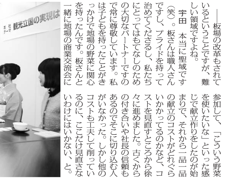
「観光立国の実現は」というテーマで、観光立国の実現を推進する。写真：小川由美子

「観光立国の実現は」というテーマで、観光立国の実現を推進する。写真：小川由美子 板場の改革もされて、参加して、「若い野菜」を使った新しい感じがして、食べてみたいという感じがする。板場さん、この「若い野菜」は、私たちが食べてみたいという感じがする。板場さん、この「若い野菜」は、私たちが食べてみたいという感じがする。