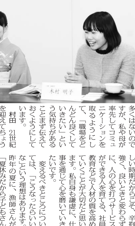
「観光立国の実現は」というテーマで、観光立国の実現を推進する。

アイパッドでグルメ案内 訪日客 ロイヤルパークで提供 NTTと本島NTTの協力で、ロイヤルパークホテルが、訪日客向けに「アイパッド」を使ったグルメ案内を開始する。