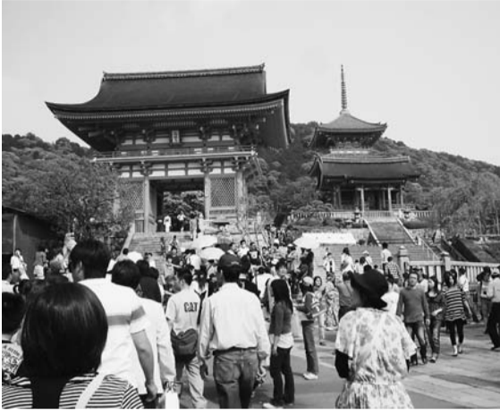
観光客に人気の清水寺

京都市の調べによると、平成21年の入洛観光客数は前年比6・6%減の4690万人で、7年以来、14年ぶりの減少。前年、初めて5千万人の大台に乗せたが、さすがの京都も「景気低迷や新型インフルエンザの影響」（産業観光局）を避けられなかった。宿泊外国人客は同16・4%減の78万人、修学旅行生は同4・6%減の96万人だった。