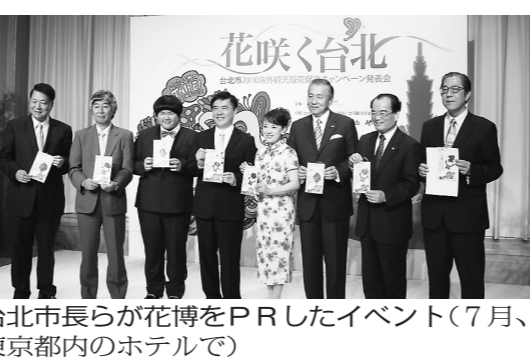
台北市長らが花博をPRしたイベント(7月、東京都内のホテルで)

台北花博は、1960年にオランダ・ロッテルダムで初開催されて以来、世界各地で盛況を博してきた。台北花博は、アジアでは90年の大阪、99年の昆明(中国)、2000年の淡路、04年の浜松湖、06年の新大園エリアの会場イメージ