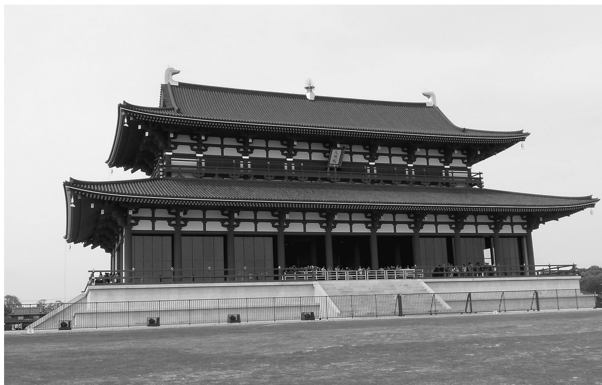
人気となっている第一次大極殿