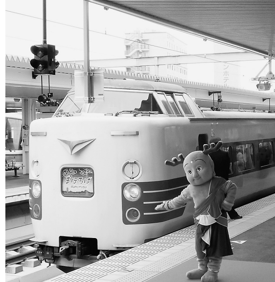
臨時特急「まほろば」号とせんとくん