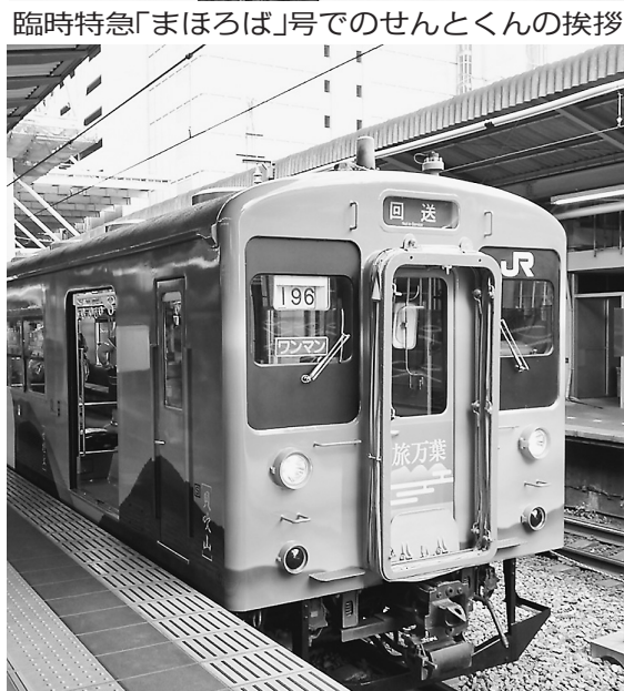
臨時特急「まほろば」号でのせんとくんの挨拶