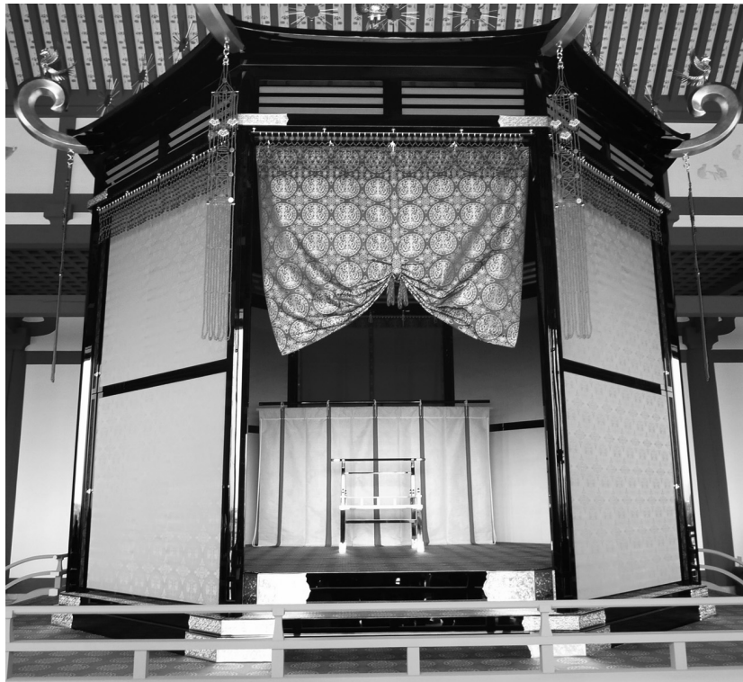
第一次大極殿の高御座(たかみくら)