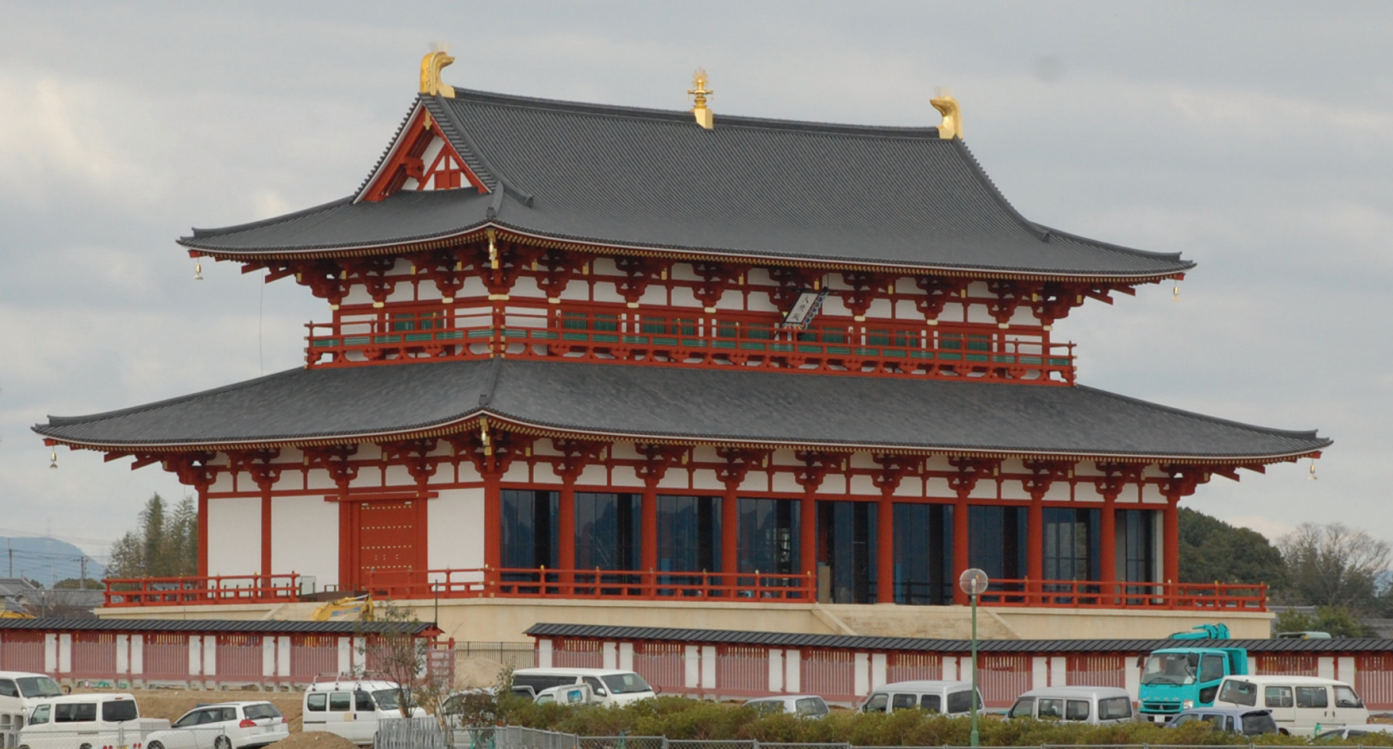
4月24日に復元される第一次大極殿