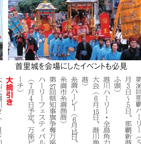
首里城を会場にしたイベントも必見

大綱引き 大綱引き(7月下旬の日曜日、宜野湾市大山小学校) 大綱引き(8月1日、宜野湾市コナヘン小学校)