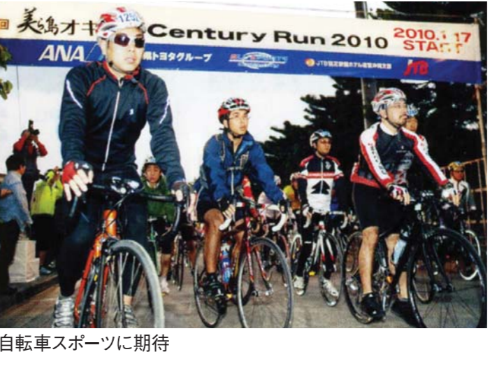
自転車スポーツに期待

コンテンツトレードショーは、10年度は、VJと連携してイギリス、スペイン、ロシアなどから誘客を推進する。スポーツコンベンションも充実。コンテンツトレードショーは、10年度は、VJと連携してイギリス、スペイン、ロシアなどから誘客を推進する。スポーツコンベンションも充実。