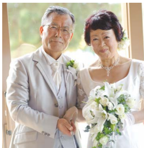
アニバーサリー婚のイメージ