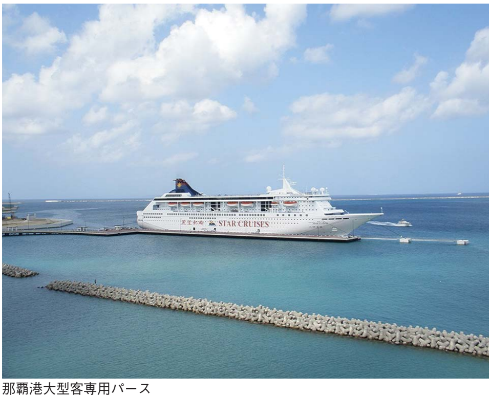
那覇港大型客専用バス

外国人観光客数は昨年度並を維持したが以前年度域観光客数に対する割合は約4%。今年度も観光客、VJやJNTOとの連携を重視している。昨年度から取り組んでいる。昨年度から取り組んでいる。昨年度から取り組んでいる。