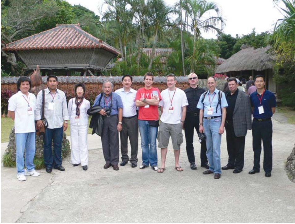
海外からのFAMツアー