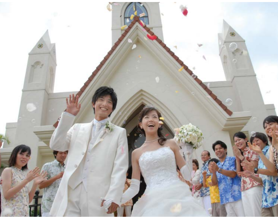
日本一のリゾートウェディング挙式数を誇る沖縄

海外からの誘致 今後は少子化の影響も出始める考え、海外とシニアを対象とした展開を開始する。海外市場への展開としては、香港、台湾、タイ、中国大陸など、近年に引き続き出展。香港はタイ、中国大陸など、近年に引き続き出展。香港はタイ、中国大陸など、近年に引き続き出展。