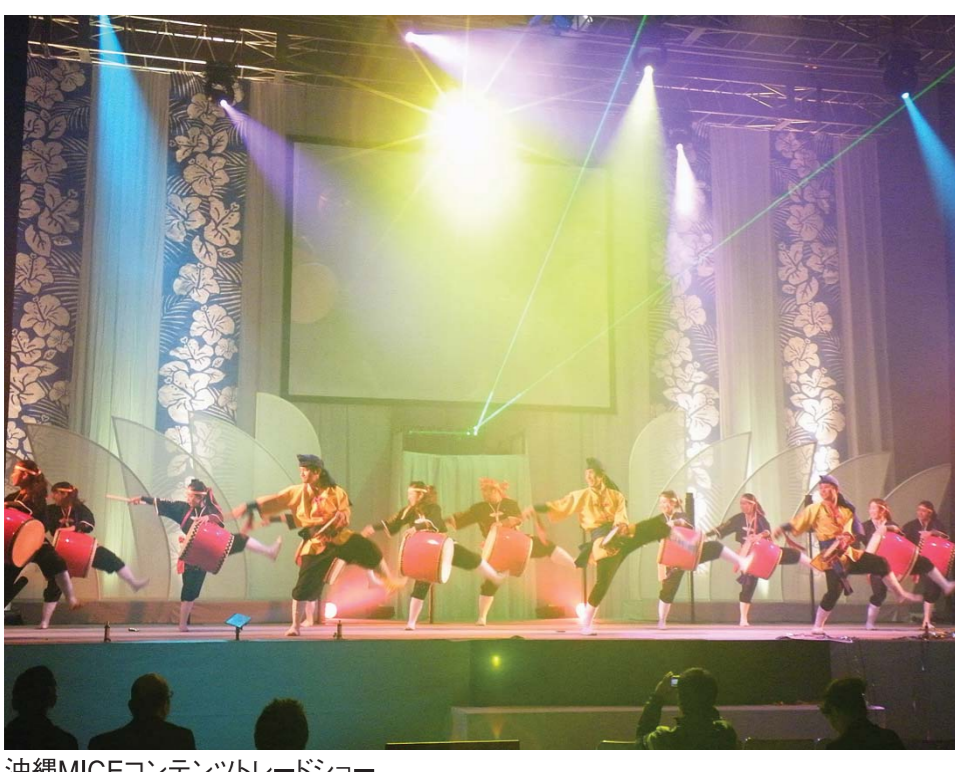
沖縄MICEコンテンツトレードショー