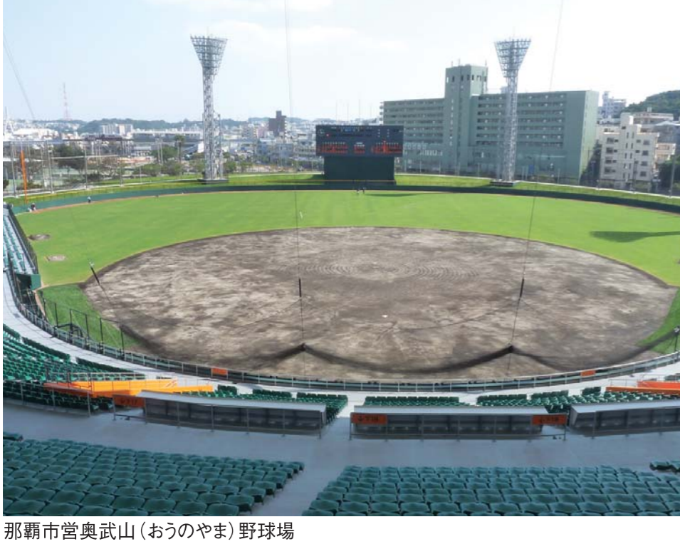
那覇市営奥武山(おうのやま)野球場