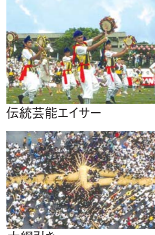
伝統芸能エイサー