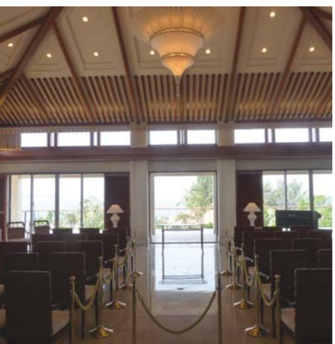
万国津梁館ウエディング

修学旅行情報提供や学校関係者を招いて、離島の現地修学旅行を行っている。沖縄は依然高い人気を誇っており、08年の統計では493校、4472人、48万6千500人、48万6千500人が参加している。修学旅行情報提供や学校関係者を招いて、離島の現地修学旅行を行っている。