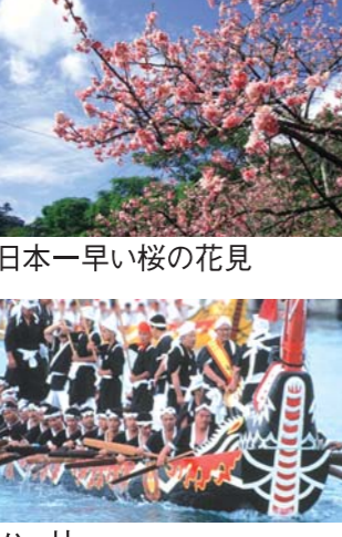
日本一早い桜の花見