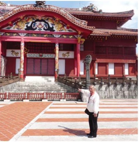
世界遺産をガイドと巡る