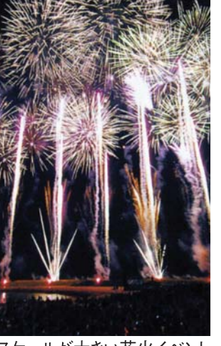
スケールが大きい花火イベント