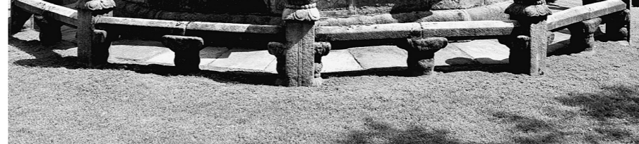
世界遺産・王陵の1つ、靖陵は地元の人々の散歩コースともなっている

このサイトを通じて観光地の情報だけでなく、宿泊や交通、お祭り、イベント、ツアー紹介、割