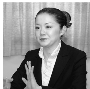
金井 旅館は「特別感」を出すために、サービスと雰囲気を磨く必要がある。若い世代には、特別なサービスだけでなく、日常的なサービスも求められる。

「特別感」を出すには、サービスと雰囲気を磨くことが重要。若い世代には、特別なサービスだけでなく、日常的なサービスも求められる。ホテルや旅館は、そのニーズに応える必要がある。