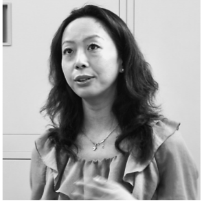
石井 旅館は「特別感」を出すために、サービスと雰囲気を磨く必要がある。若い世代には、特別なサービスだけでなく、日常的なサービスも求められる。