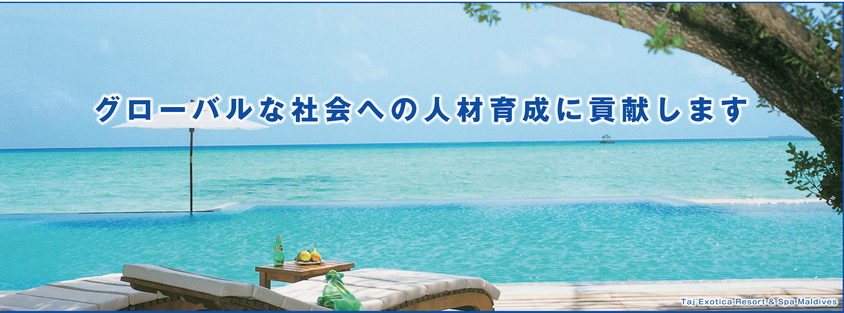
Taj Exotica Resort & Spa Maldives