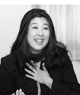
相馬 昔はメディアが限られていたが、今はSNSが盛んになり、女性も積極的に発信する人が増えている。その分、本物の魅力が伝わりやすくなった。一方で、競争も激しくなっている。だからこそ、自分たちの強みを活かして、個性を出さなければならない。

「原素回帰」という話もありました。宿や観光地がこれからどうしたいかについて、自分たちの本当の魅力は何なのかを再考する。時代は変わって来ましたが、温泉と山の景色が好きな人は来ません。でも温泉と山は置きかたえして新しい体験メニューを考えても、結局人が来ない。どうしてか、多くの人々が何を求めているのかを再考する必要があります。