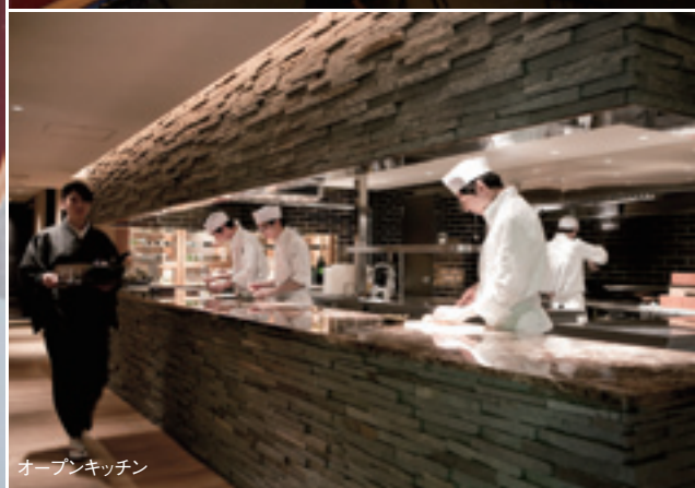
オープンキッチン