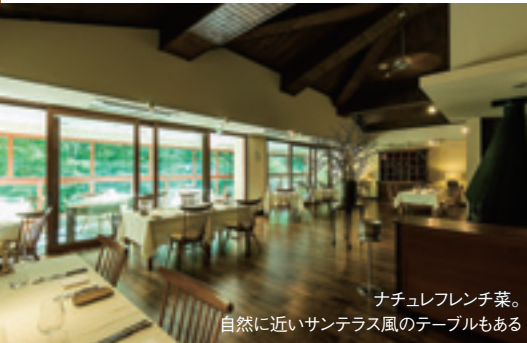
ナチュラルフレンチ菜。 自然に近いサンテラス風のテーブルもある