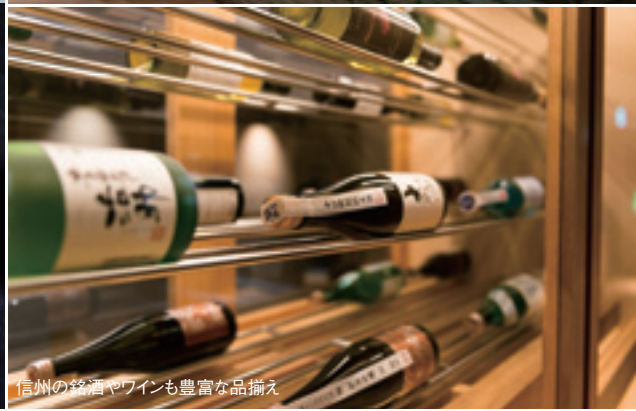
信州の銘酒やワインも豊富な品揃え