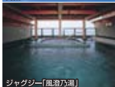
ジャグジー「風澄乃湯」