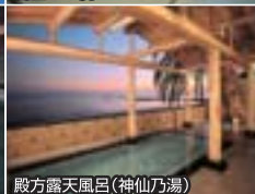
殿方露天風呂(神仙乃湯)