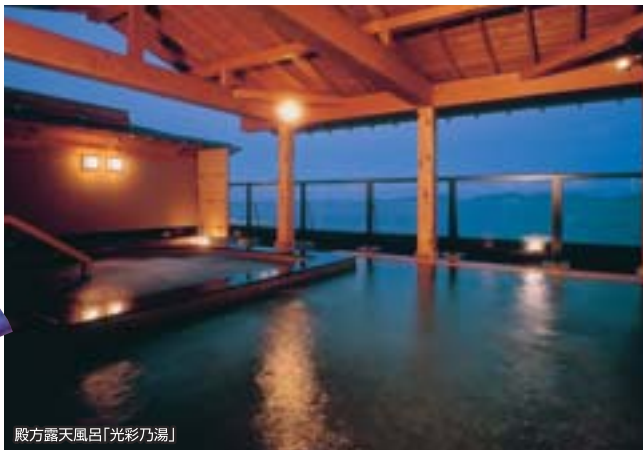
殿方露天風呂「光彩乃湯」