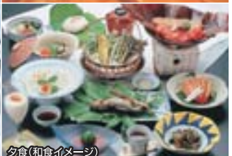
夕食(和食イメージ)

夕食は旬の月替り会席(和食) 品数約9品、うち1品出しは約4品 夕食は和食・洋食・中華よりお選びいただけます。 夕食時に料理内容を説明いたします ◆お食事場所 夕食・レストラン(和食のみ個室指定可。要事前連絡) 朝食・レストラン(和定食又はバイキング)