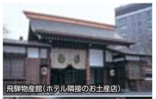
飛騨物産館(ホテル隣接のお土産店)