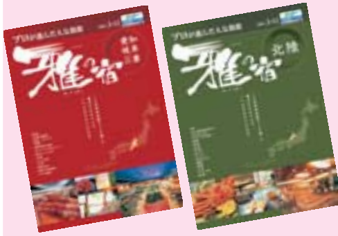
雅の宿(愛知・岐阜・三重)