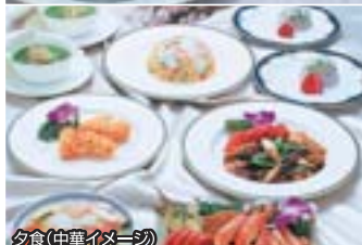
夕食(中華イメージ)