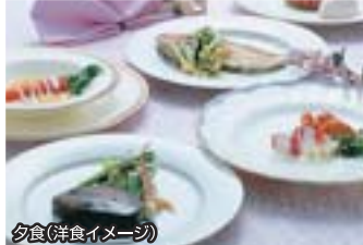
夕食(洋食イメージ)