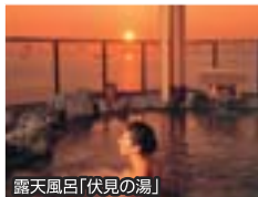
露天風呂「伏見の湯」